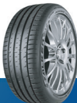
AZENIS | FK520

FÅ EN CIRCLE K BRÄNSLEVOUCHER eller LADDNINGSKREDIT