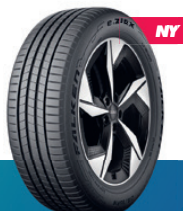
ZIEX | e. ZIEX