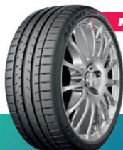
AZENIS | RS820