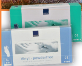
Engånghandskar Vinyl eller nitril